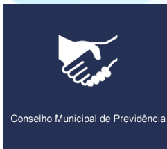
Conselho Municipal de Previdência